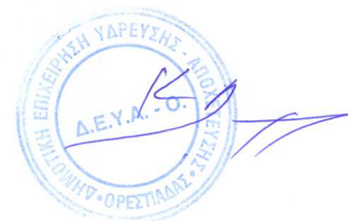
Κωνσταντίνος Δημόπουλος Αρχιτέκτων Μηχανικός