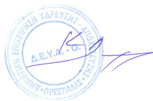
ΔΗΜΟΠΟΥΛΟΣ ΚΩΝΣΤΑΝΤΙΝΟΣ ΑΡΧΙΤΕΚΤΩΝ ΜΗΧΑΝΙΚΟΣ